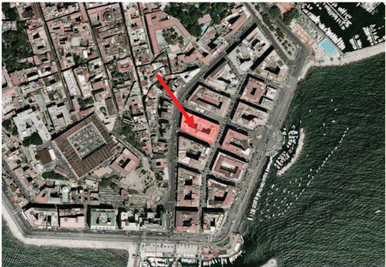
Fig. 01 Inquadramento territoriale con indicazione del fabbricato esistente