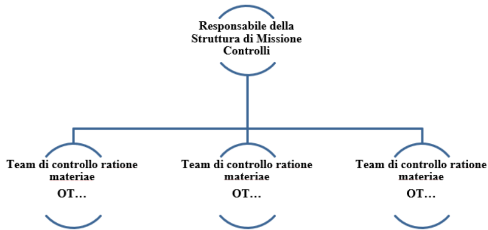
Figura 1: Struttura organizzativa della Struttura di Missione Controlli.

In termini di responsabilità e conformità al requisito di “adeguata separazione delle funzioni” previsto dagli artt. 72, lett. b e 125 § 7 del Reg (UE) n. 1303/2013, la struttura organizzativa dei controlli di I livello, supportata dall’Assistenza Tecnica, presenta le seguenti caratteristiche: