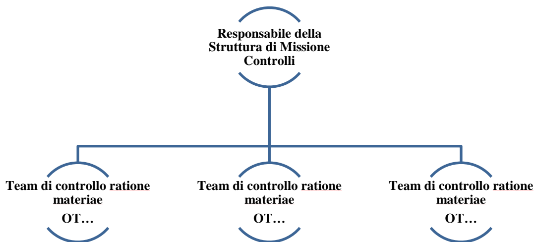
Figura 1: Struttura organizzativa della Struttura di Missione Controlli.

In termini di responsabilità e conformità al requisito di “adeguata separazione delle funzioni” previsto dagli artt. 72, lett. b e 125 § 7 del Reg (UE) n. 1303/2013, la struttura organizzativa dei controlli di I livello, supportata dall’Assistenza Tecnica, presenta le seguenti caratteristiche: